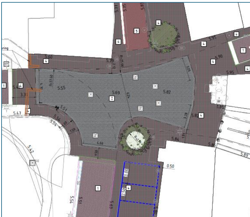
Nieuw ontwerp stadsentree Dorpsweg

De entree Dorpsweg is uitgevoerd volgens ontwerp, waarbij keien zijn gebruikt. Na realisatie ontving de gemeente en u als raad veel meldingen van inwoners over de slechte begaanbaarheid van dit materiaal. Dit was aanleiding om een enquête uit te voeren onder bewoners, zodat deze ervaringen konden worden meegenomen bij het ontwerp van de stadsentree Stadlaan. De resultaten van deze enquête zijn met u gedeeld via een ARI. Op basis van de enquêteresultaten heeft de gemeente een aangepast ontwerp gemaakt waarin de loopstroken worden verbreed en de keien vervangen door gebakken klinkers. De kosten voor deze aanpassingen aan de entree Dorpsweg zijn geraamd op € 60.000,=