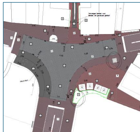
Optie 2 Geraamde kosten € 100.000,=