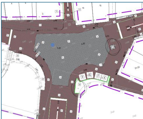
Optie 1 Geraamde kosten € 105.000,=

Voor dit deelproject moet geld beschikbaar gesteld worden door de gemeenteraad in dit raadsvoorstel zal worden voorgesteld af te wijken van het originele plan en te kiezen voor optie 2.